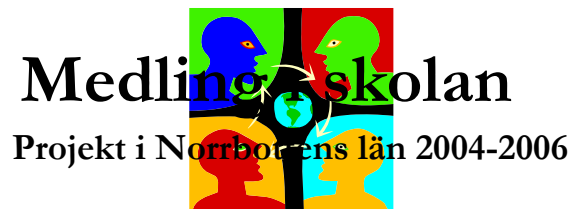
Figur 1 Organisations struktur projektet Medling i Skolan