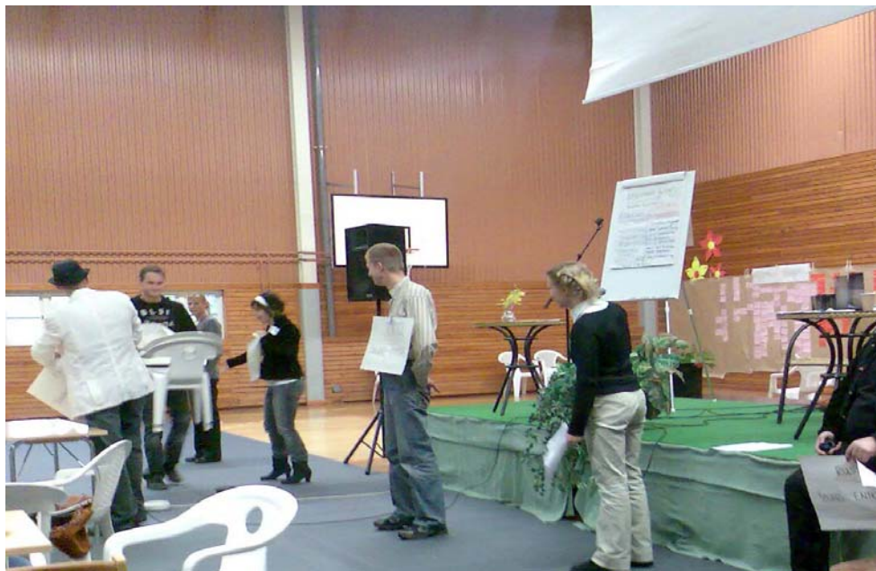
Young Entrepreneurs in Barents Region, ungdomsforum 21-24 september 2006 i Svanstein.