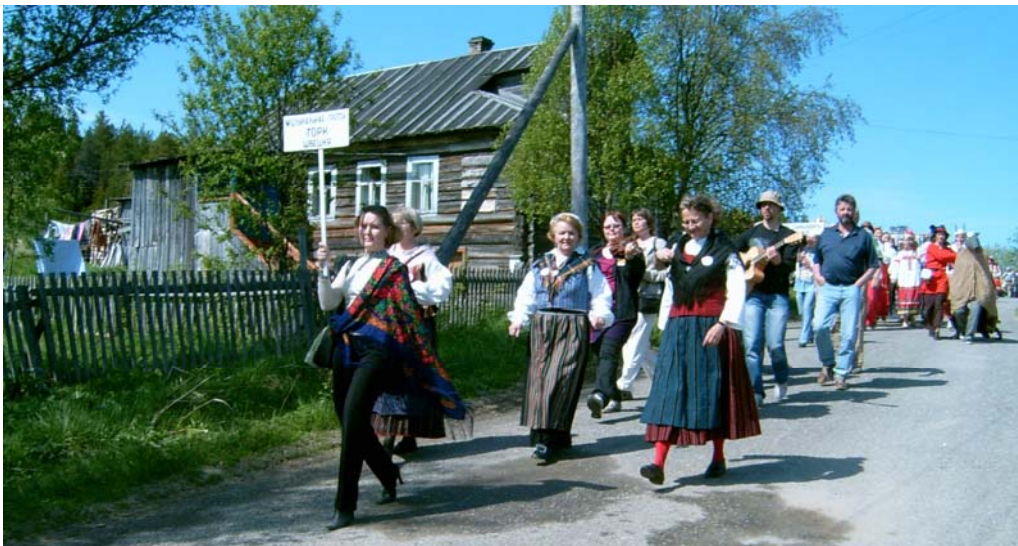
Norrbottensdeltagare och musikgruppen Gork i festivaltåget, Umba, Tersky rajon, juni 2005