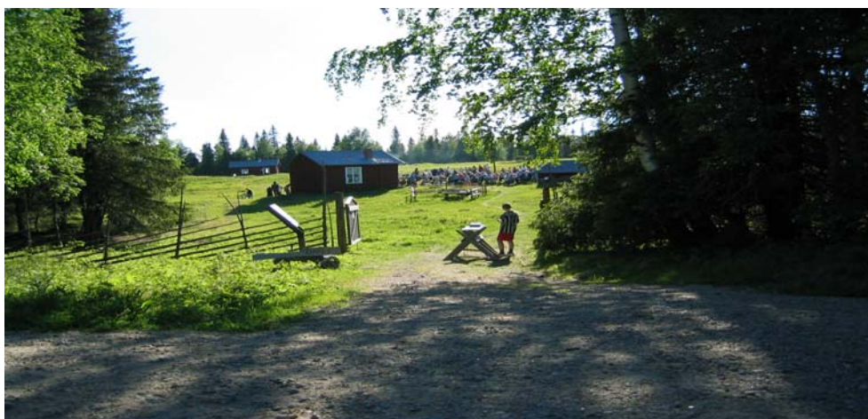
Exempel på lokal utveckling i Tornedalen, Hanhivittikko Fäbod