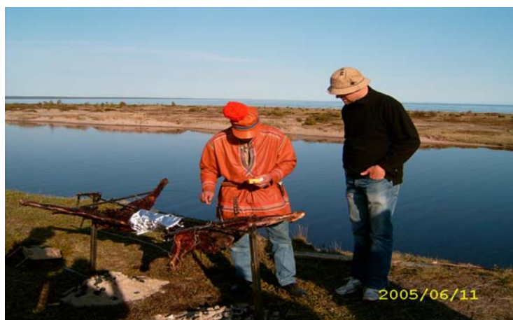
Norrbotten tillagar och bjuder på helstekt ren vid Vita Havets strand, Tersky rajon, Umbafestivalen juni 2005.