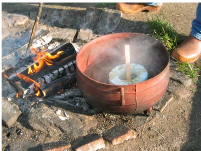
Vildmarkskurs för ryska mikroföretagare, oktober 2006 Haparanda