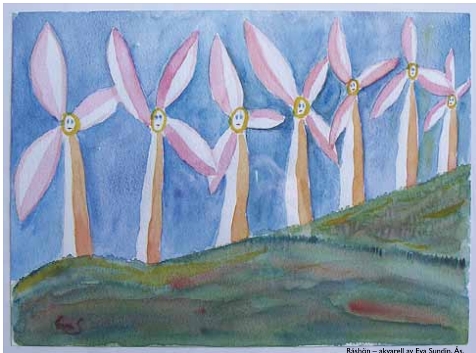
Råshön – akvarell av Eva Sundin, Ås.

- Vad händer med avtalet om vindparken eller delar därav säljs eller på annat sätt övergår till ny ägare?